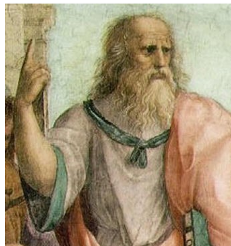
© Détail de Platon dans L'école d'Athènes , Raphaël (1512)

Pour que les élèves nous écoutent, il faut être un expert de sa discipline. Notre quotidien, c'est de tenir ces rênes invisibles qui permettent au groupe la concentration et d'éviter à ces chevaux fougueux de se dissiper. C'est en étant un spécialiste de haut niveau de son savoir qu'on trouve les ressources en nous pour répondre aux questions improvisées, guider les apprentissages, concevoir des enseignements de qualité. Une autorité qui n'est pas fondée sur du savoir n'est qu'une revendication narcissique, et qui suscite des rébellions narcissiques.